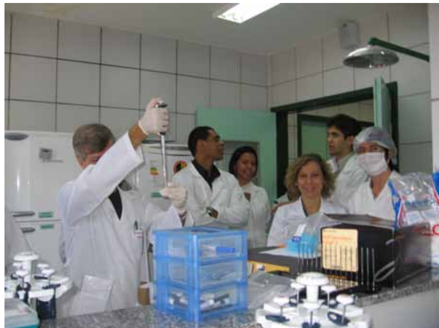
Participantes do curso realizam testes com equipamento fornecido pela Prodimol.

Os professores são peritos criminais do Instituto de Criminalística de Minas Gerais e pós-doutores na área de DNA da Universidade Federal do Rio de Janeiro. Participam profissionais do Acre, Alagoas, Ceará, Espírito Santo, Maranhão, Paraíba, Pernambuco, Piauí, Rio Grande do Norte, Roraima e Tocantins. Ao todo, o curso tem 40 horas/aula e vai até o dia 3 de julho.