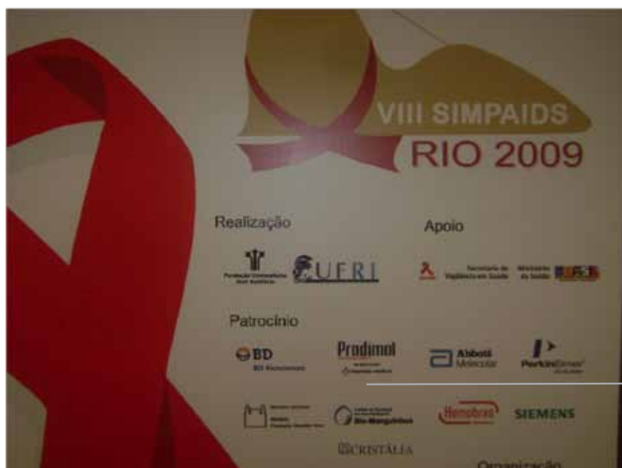
Patrocínio rendeu a Prodimol um lugar de destaque no evento.